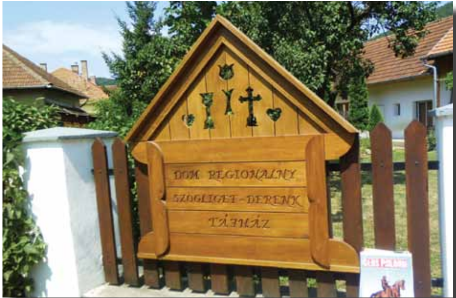
Dom regionalny w Derenku

Tevékenységeinek végzése közben volt még egy másik nagyon fontos vezérelv: a folyamatosan változó jogszabályi környezetben a vonatkozó törvények maradéktalan betartása. Ez adja meg azt a biztos hátteret, ami szükséges a magyarországi lengyelség támogatásához és összefogásához.