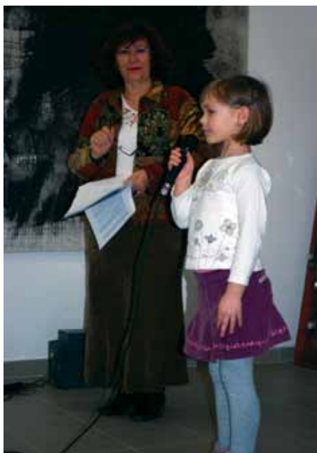
Konkurs recytatorski w Szkole Polskiej, fot. ZN

OSP swoją działalnością wspiera podtrzymywanie pamięci o najdawniejszych korzeniach polonijnych na Węgrzech (...) polskie wychowanie i oświatę.