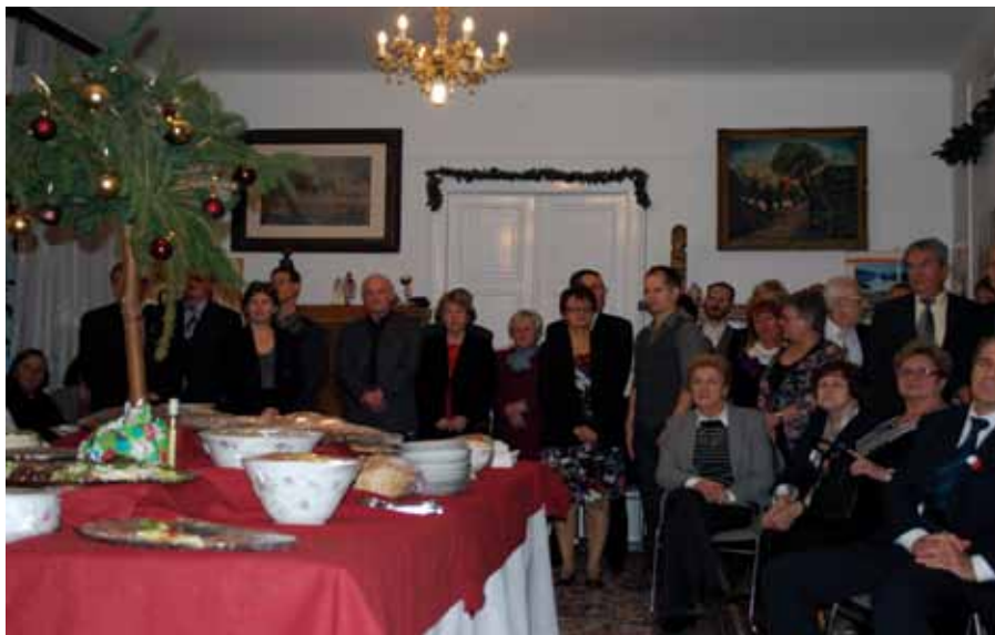
Oplatek w „Bemie”