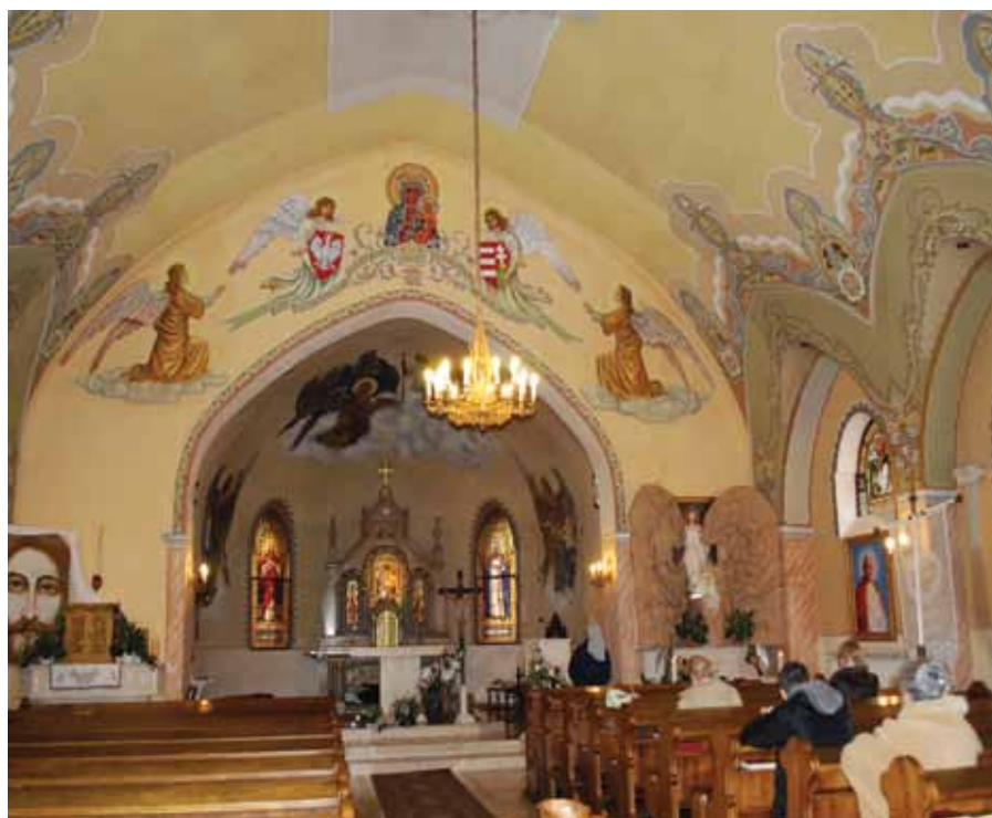
Odnowiony Kościół Polski

a lengyel és magyar fiatalok találkozóinak megrendezése, kapcsolataik kialakítása pl. az őket érdeklő téren, sportnapok keretein belül, az ország különböző városaiban;