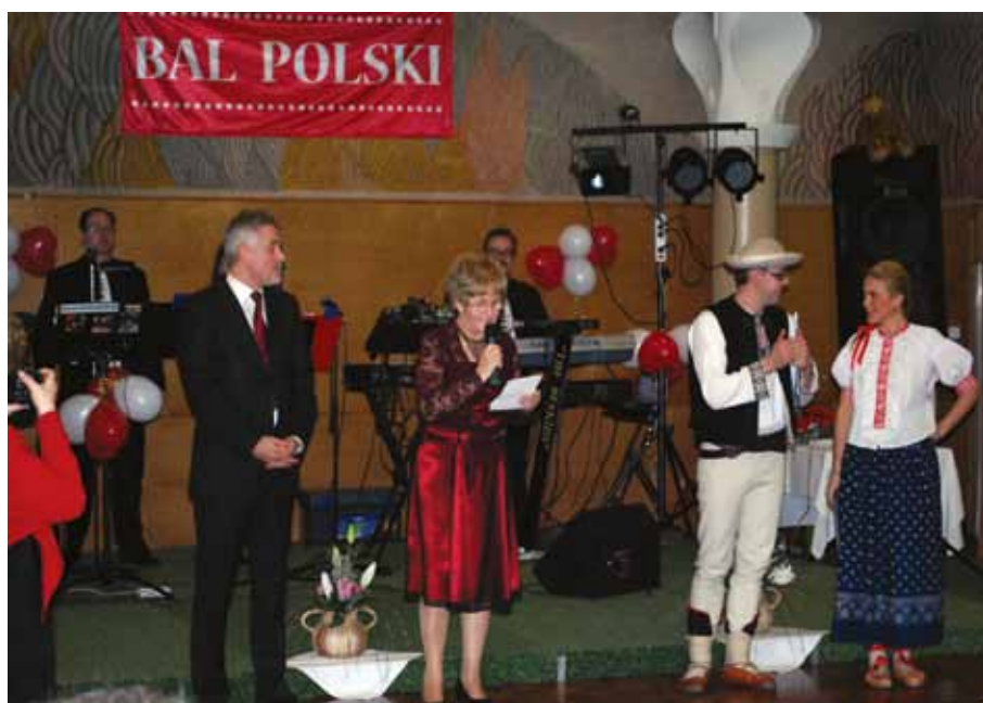
Bal Polski