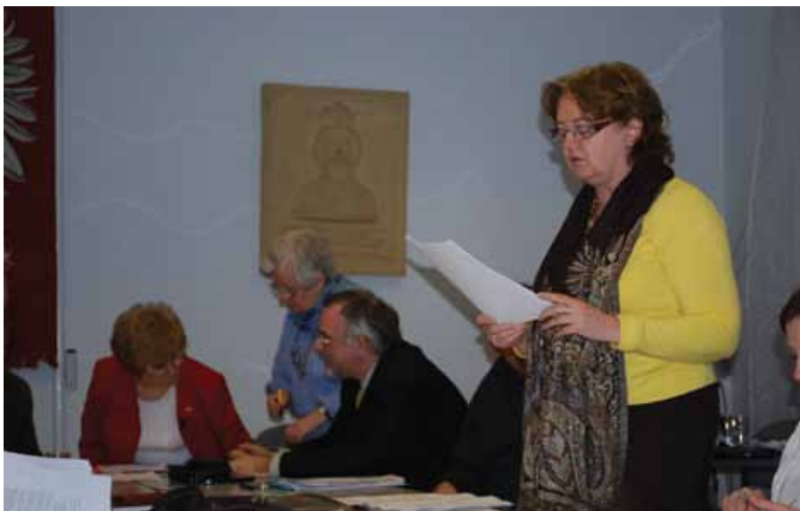
Posiedzenie samorządu