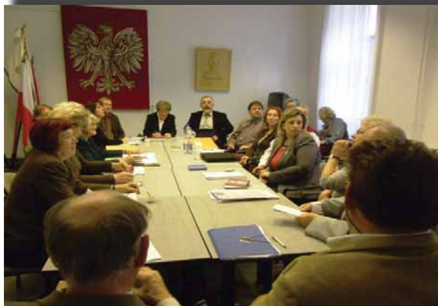
Posiedzenie OSP

W działalności naszego Samorządu w przeciągu ostatnich czterech lat był jeszcze jeden istotny element, a mianowicie absolutne stosowanie się do stale zmieniających się podstaw prawnych, określających działalność samorządów mniejszościowych na Węgrzech, co daje bezpieczne gwarancje dla działalności polonijnej oraz pozyska-