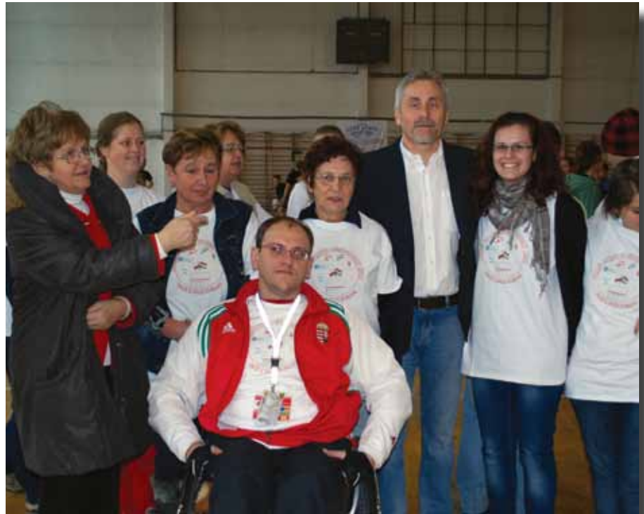
Dzień Sportu

• sprowadzenie wartościowej kopii obrazu Matki Boskiej Częstochowskiej do Bazyliki św. Stefana w Budapeszcie