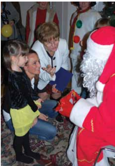
Mikołaj w PSK im. J. Bema

• doroczne organizowanie Święta Polonii Węgierskiej – Dnia św. Władysława, obchodzonego w Szabolcs, Somogyvár, Miskolu oraz w Budapeszcie