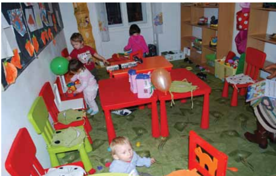
Przedszkole w „Bemie”

E gy dolog azonban biztos: az októberben leköszönő önkormányzat testületének tagjai emelt fővel és büszkén adhatják át a következő csapatnak az OLŐ vezetését, mert egy stabil finanszírozású, széles tevékenységi körű intézménycsoportot hoztak létre.