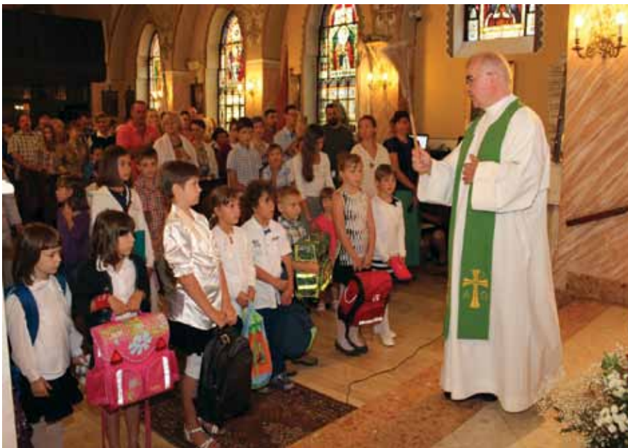
Rozpoczącie roku szkolnego w Polskiej Parafii

• lengyel óvoda fenntartása, amely a Magyarországi Bem József Lengyel Kulturális Egyesület mellett működik, a Lengyel Anyák Klubjának létrehozása;