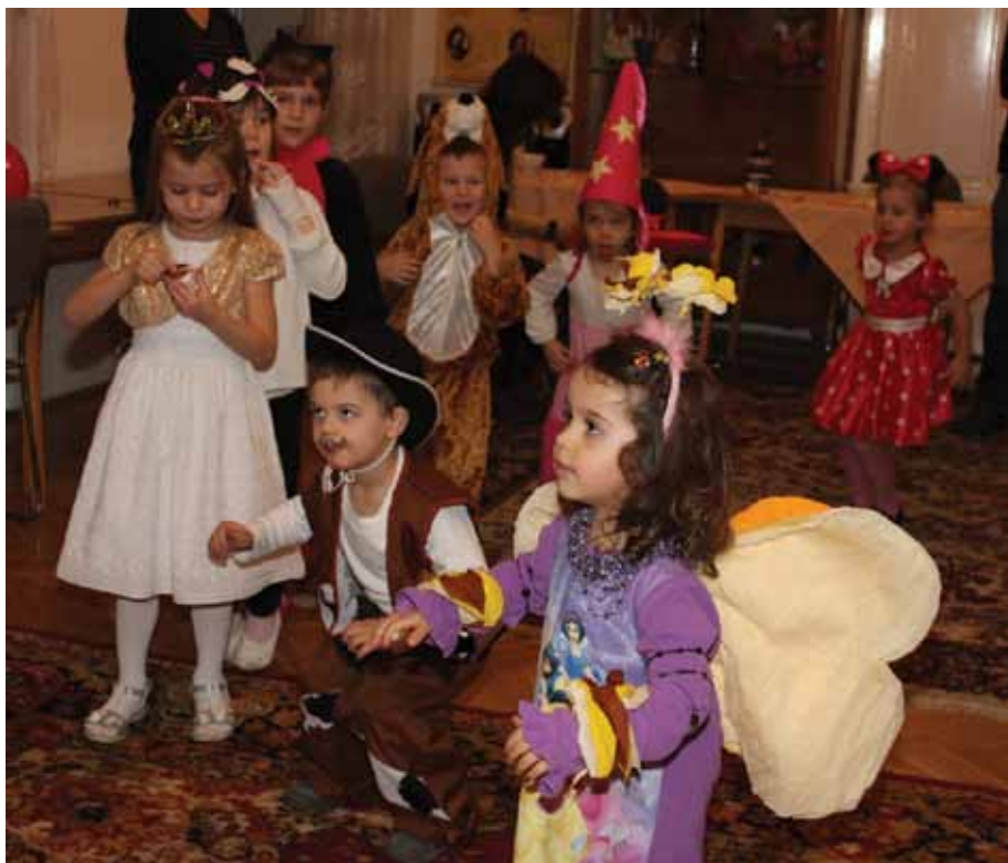
Bal Przebierañców w PSK im. J. Bema

a Lengyel Köztársaság Budapesti Nagykövetségével való együttműködésben lengyel régiók promóciója Magyarországon – kulturális, oktatási, gazdasági téren –, ezt remélhetőleg sikerül a jövőben az Európai Unió támogatásával kiegészíteni;