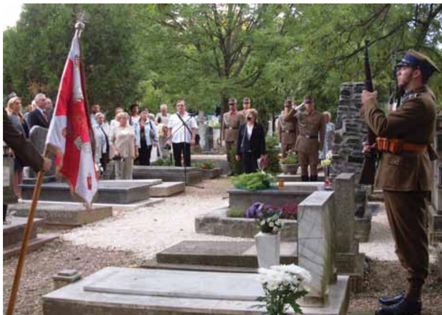
Polonia na cmentarzu Farkasrét

• Bal Polski, organizowany już tradycyjnie co roku w lutym, którego celem jest integracja Polaków rozsianych na całych Węgrzech